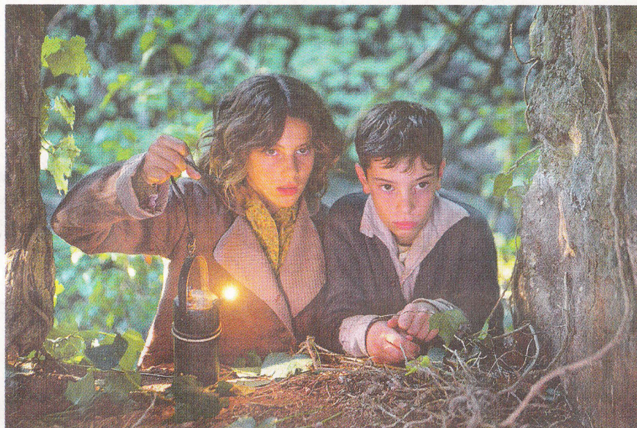
Goya du meilleur espoir pour les deux jeunes acteurs de Pa Negro .

CINÉMA «Pa Negro» d'Agusti Villaronga a remporté neuf statuettes aux Oscars espagnols.